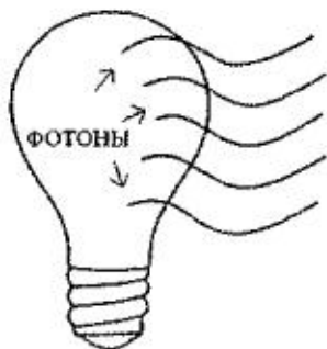
Лазер (когерентный свет)

окружающим миром. П-сознание порождает гармонию и не причиняет вреда.